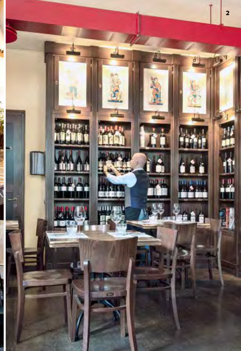
1 | L'ingresso del ristorante Scigno del Duomo , in un edificio storico a due passi dalla cattedrale. 2 | All' Osteria del Pettiroso si ordinano piatti della tradizione rivisitati. 3 | Una sala del Mart di Rovereto, uno dei musei più visitati: le sue collezioni d'arte spaziano dall'Ottocento ai giorni nostri.