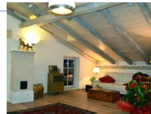
Trento: da sinistra, Federico Parolari, chef dell'Osteria A le due spade e un interno dell'hotel Casa del pittore.

20 GALLERIE DI PIEDICASTELLO Spazio espositivo ricavato in due ex tunnel stradali dedicato al racconto della storia del Trentino | Indirizzo: piazza di Piedicastello, Trento | Tel. 0461.23.04.82 | Web: museostorico.it